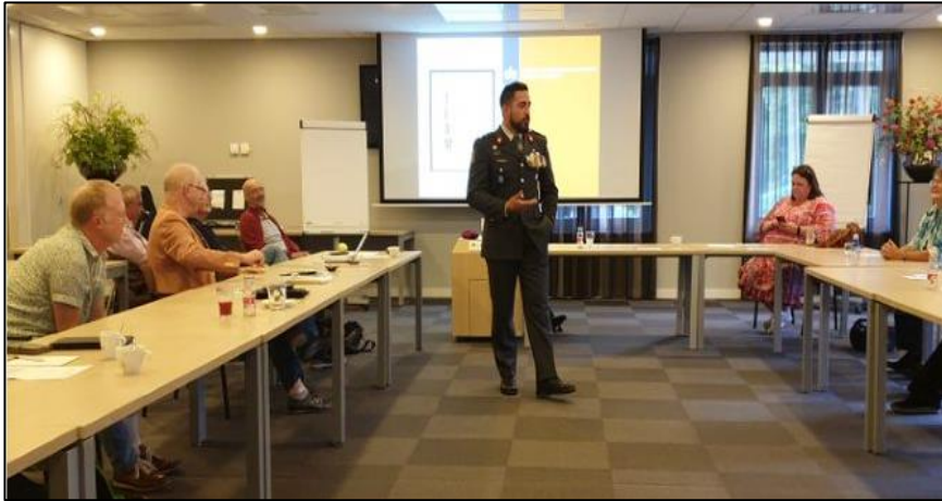
Afbeelding 3: vrijwilligersdag 11 september, presentatie instructeur van Defensie

De op 20 november geplande strategiedag in Amersfoort moest helaas vanwege de weer opflakkerende coronapandemie worden afgezegd. Jammer genoeg kon deze dag niet op korte termijn online worden ingepland. In januari en februari 2022 heeft het bestuur vervangende overleggen met de contactgroepen gehad.