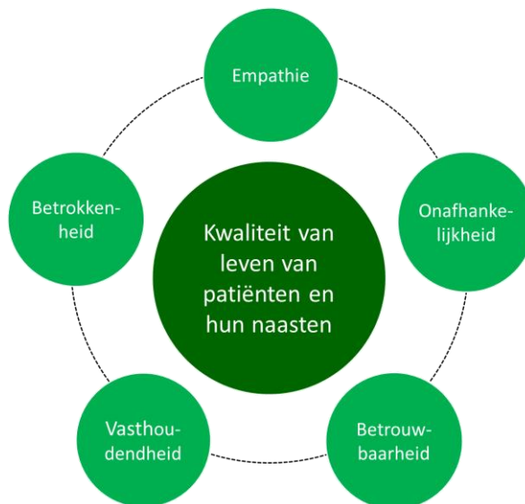
Afbeelding 1: kernwaarden Patiëntenplatform Sarcomen

PPS heeft de volgende kernwaarden geformuleerd. Het bestuur ziet erop toe dat deze kernwaarden bij uitoefening van de verschillende activiteiten en initiatieven worden uitgedragen en gerespecteerd.