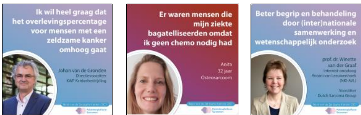
Afbeelding 6: voorbeelden bijdragen Week van de Zeldzame Kanker

Door de betrokkenheid van alle expertisecentra, de patiënten en specialisten die hun verhalen deelden, de achtergrondverhalen van Kanker.nl, IKNL en KWF Kankerbestrijding en de Dutch Sarcoma Group (DSG) was het mogelijk om in deze week een stevig statement te maken. Mede door de indrukwekkende patiëntverhalen. In totaal werden er 20 sarcoomgerelateerde bijdragen gemaakt en op social media en websites geplaatst.