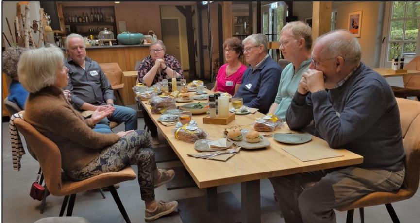
Afbeelding 4: regiobijeenkomst GIST-patiënten Ospel 2021

De contactgroep GIST heeft wel tussen de verschillende coronamaatregelen door 3 regionale contactdagen (2 oktober Delft, 15 oktober Ospel en 22 oktober Kampen) kunnen organiseren. Voor de andere contactgroepen konden er helaas geen contactdagen worden georganiseerd.